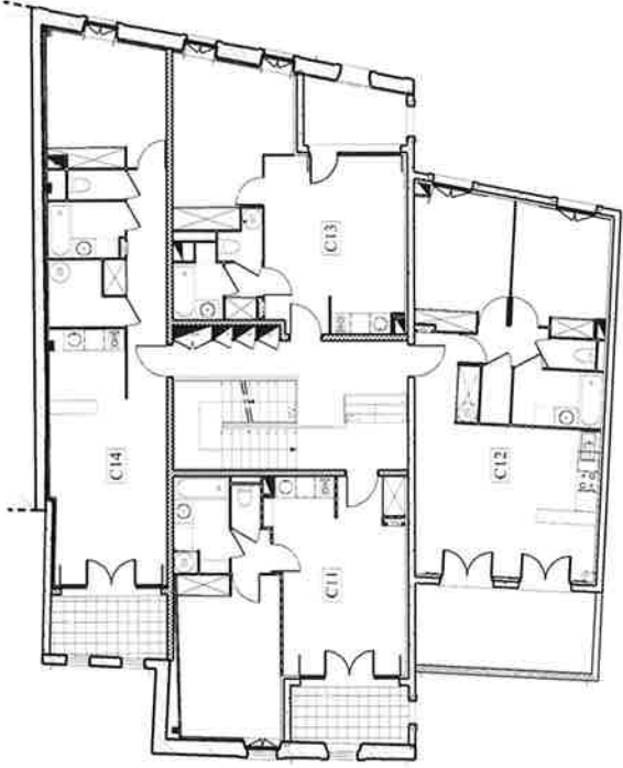
Plan du 1er étage